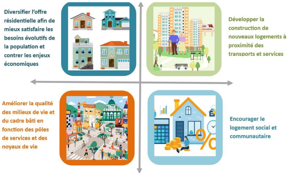
Figure 1 : Extrait des 4 axes d'intervention de la MRC des Laurentides en matière d'habitation